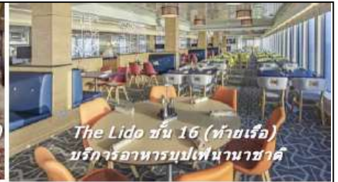
The Lido ชั้น 16 (ท้ายเรือ) บริการอาหารบุฟเฟต์นานาชาติ

หมายเหตุ ทุกท่านสามารถเลือกซื้อแพ็คเกจเครื่องดื่มได้ ในระหว่างที่อยู่บนเรือสำราญตลอดการเดินทาง เพียงใช้ CRUISE CARD ในการสั่งซื้อ รายละเอียดของแพ็คเกจสามารถขอได้จากเจ้าหน้าที่บนเรือสำราญ