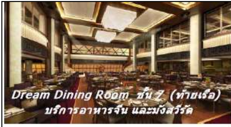
Dream Dining Room ชั้น 7 (ท้ายเรือ) บริการอาหารจีน และมังสวิรัต