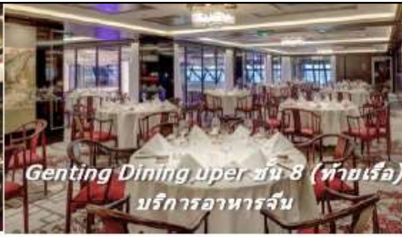
Genting Dining upper ชั้น 8 (ท้ายเรือ) บริการอาหารจีน